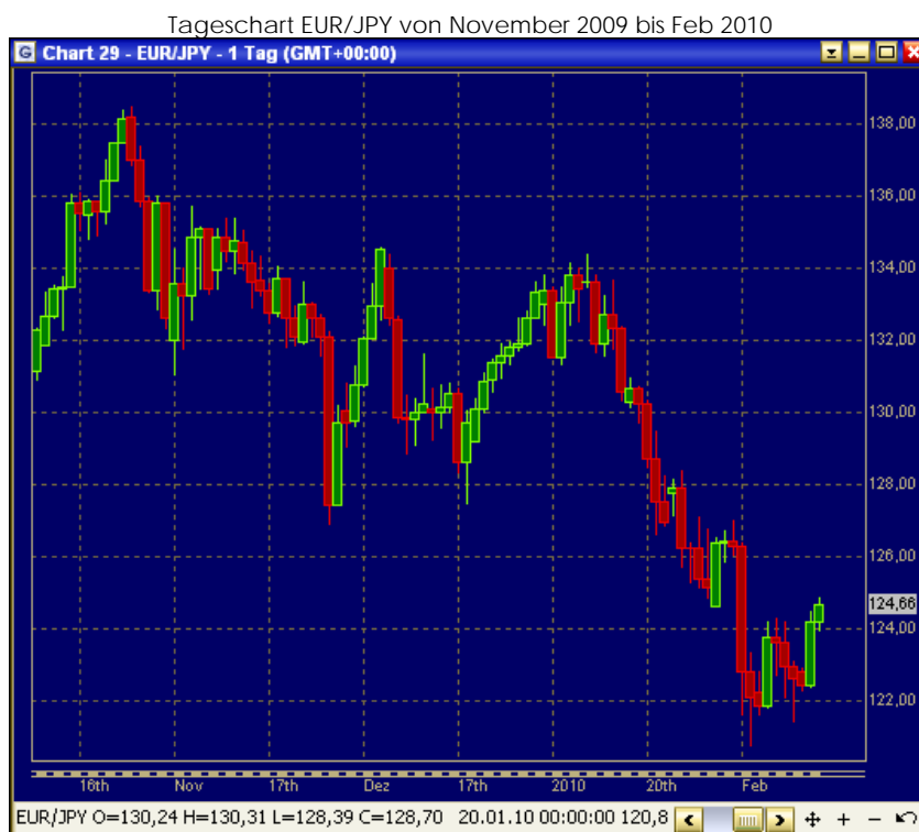
Chart von www.GTHmarkets.com zur Verfügung gestellt.

Der Widerstand liegt bei 132,00 und die Unterstützung bei 120,00 bis 121,00.